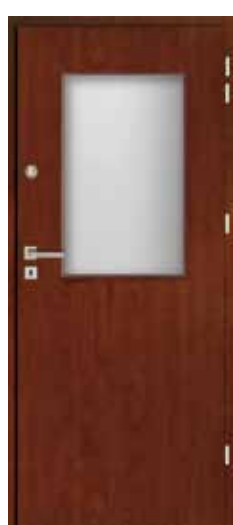
TECHNICZNE SZKŁONE 3

Techniczne Classic EI30,H” 32db 1299zł netto | 1597,77zł brutto FF Elegance Classic Plus EI30,H” 32db 1699zł netto | 2089,77zł brutto PCV Techniczne Szklone 1 EI30,H” 32db 1990zł netto | 2447,70zł brutto FF