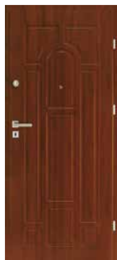
ELEGANCE CLASSIC PLUS