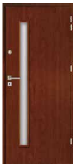
TECHNICZNE SZKŁONE 1