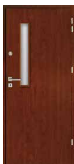
TECHNICZNE SZKŁONE 2